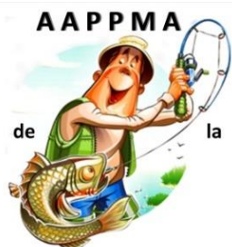
Vallée du GIROU (31)

L'assemblée générale ordinaire de l'association AAPPMA se tiendra dans la salle de la mairie de Gragnague le mercredi 7 février à 18h30 .